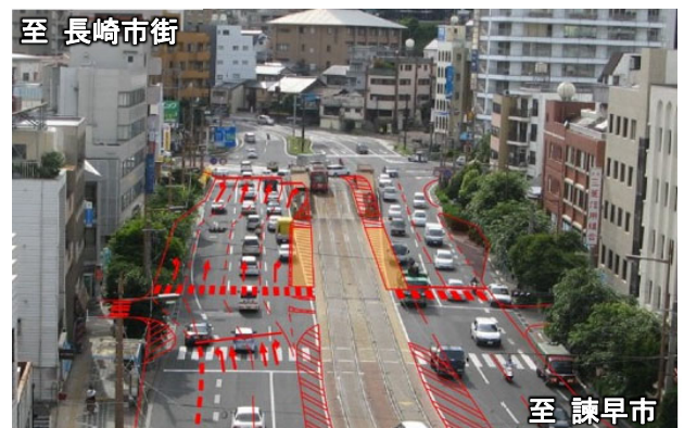
対策後イメージ図