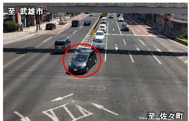
佐々町方面から武雄市方面を望む