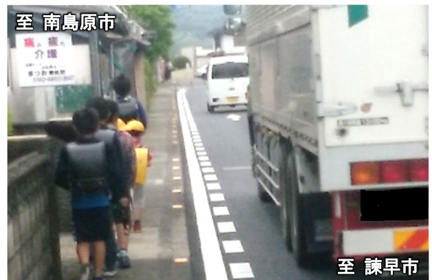
諫早市方面から南島原市方面を望む