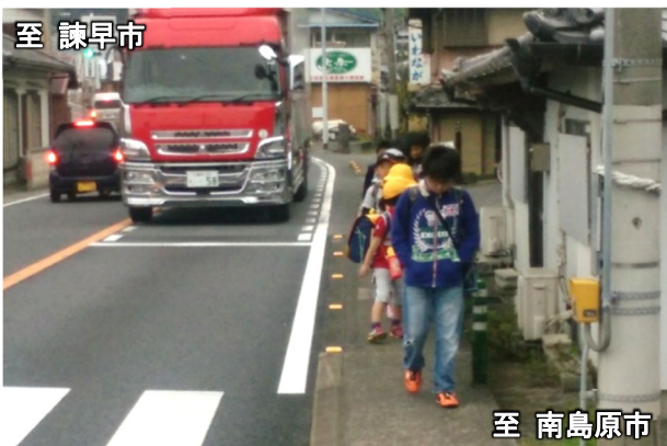
南島原市方面から諫早市方面を望む