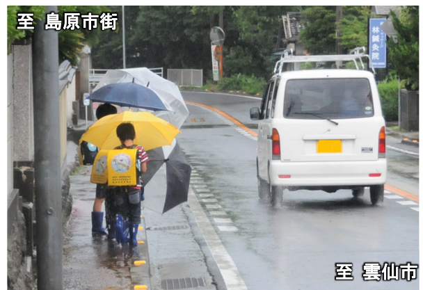
雲仙市方面から島原市街方面を望む