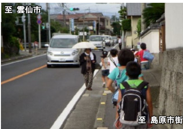
島原市街方面から雲仙市方面を望む