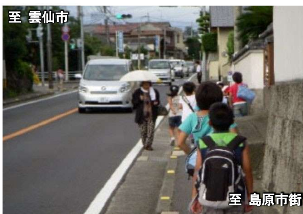
島原市街方面から雲仙市方面を望む