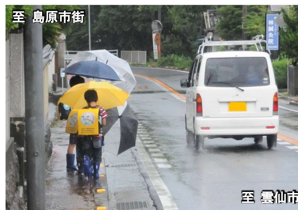
雲仙市方面から島原市街方面を望む