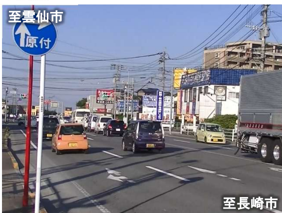
長崎市方面から雲仙市方面を望む