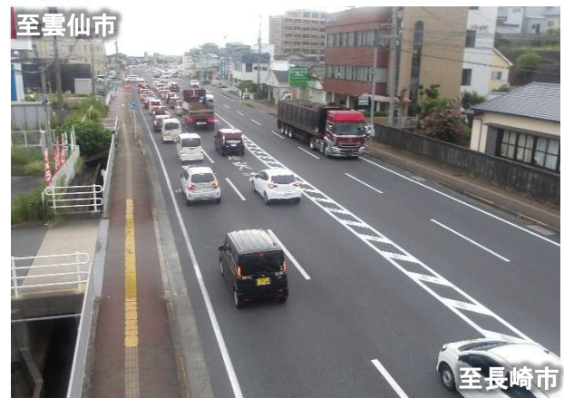
長崎市方面から雲仙市方面を望む