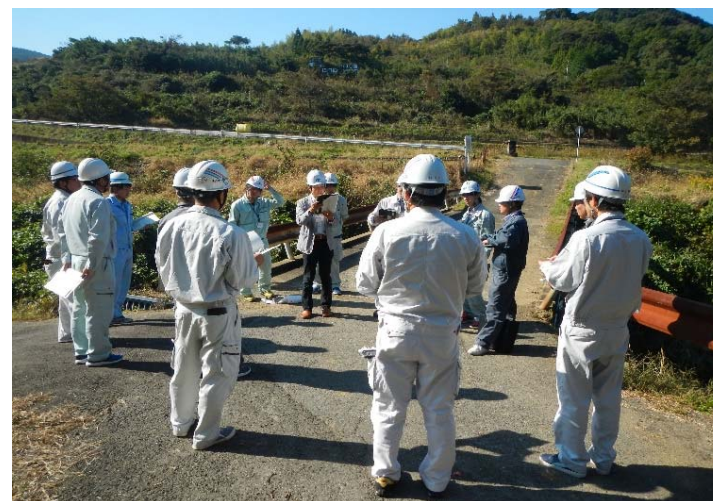
H29佐世保会場 現場実習