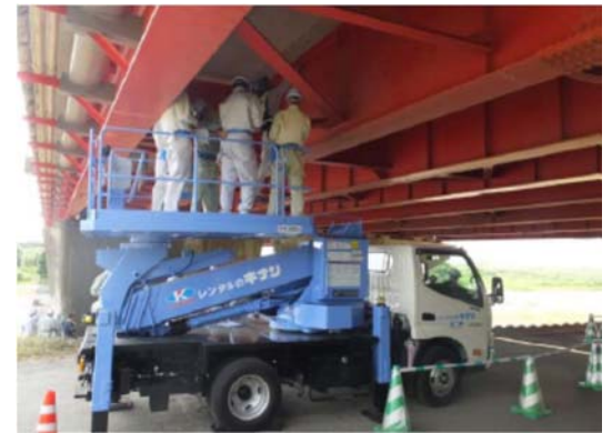
橋梁初級Ⅰ研修の状況