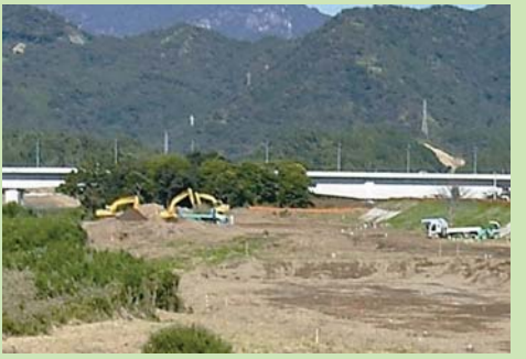
五ヶ瀬川の天下橋下流の河道掘削状況

五ヶ瀬川では、平成20年度末までに、大瀬川(浜砂地区、古城地区、大貫地区)、五ヶ瀬川(岡富・古川地区、本小路・北小路地区)の掘削を実施してきました。今後、五ヶ瀬川(野田地区、河口開口)、大瀬川(隔流地区)の河道掘削を実施します。