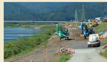
大瀬川の大瀬大橋下流左岸の河道掘削状況