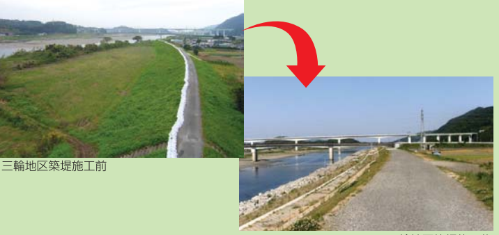
三輪地区築堤施工前

五ヶ瀬川(三輪地区)の堤防は、平成20年度末に完成しました。また、五ヶ瀬川(岡富・古川地区)については、宮崎県、延岡市土地改良区と連携し、宅地及び道路改良工事と併せて、堤防のかさ上げを実施します。