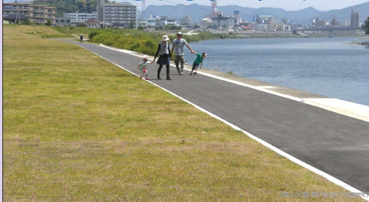
大瀬川の大瀬大橋下流左岸の河道掘削完了