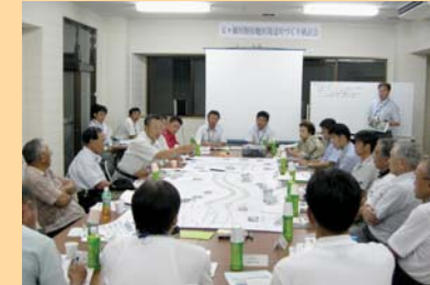
第1回検討会の様子

また、整備後の管理面について、役割分担を決めパートナーシップによる維持管理を行っていくことを検討会のメンバーにより決定しました。