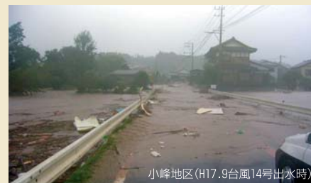
小峰地区(H17.9台風14号出水時)

五ヶ瀬川・大瀬川・祝子川・北川が市の中心部を流れる延岡市では、平成17年に発生した台風14号により、軒並み戦後最高となる水位を記録し、市内5ヶ所では堤防を越水、河川水位の上昇による内水被害が発生するなど大きな爪跡を残しました。