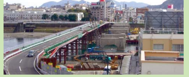
安賀多橋架替の状況

架け替えを行うにあたり「安賀多橋の景観を考える会」を3回開催し、これまでの安賀多橋の景観を損なわないよう橋面のデザインや色彩等を決定しました。工事は、現在までに仮設橋を設置し交通の迂回を確保した上で、旧橋の上部工撤去が完了しています。平成21年度は、前年度から継続して旧橋の橋脚撤去と新橋の橋脚設置及び上部工を実施します。