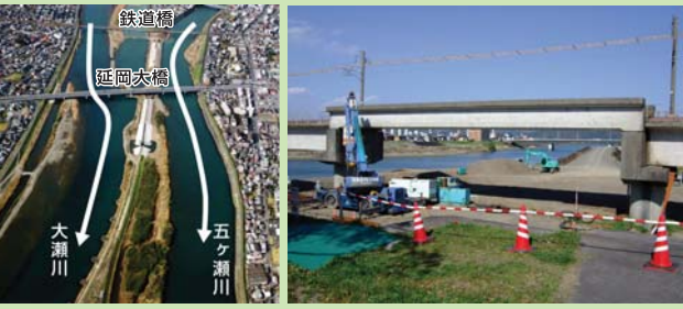
JR日豊本線付近の施工状況

現在、JR日豊本線付近の工事を実施中であり、総延長約760mのうち、平成20年度末までに約500m完成しています。今後は、延岡大橋付近の工事を実施します。