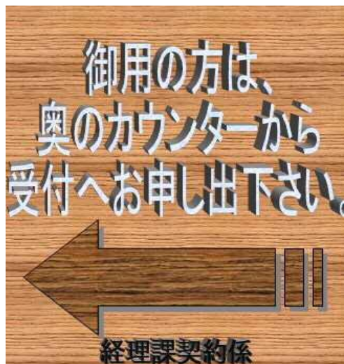
掲 示 例 3