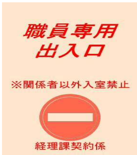
掲 示 例 2