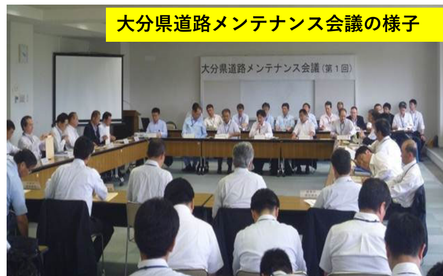
大分県道路メンテナンス会議の様子