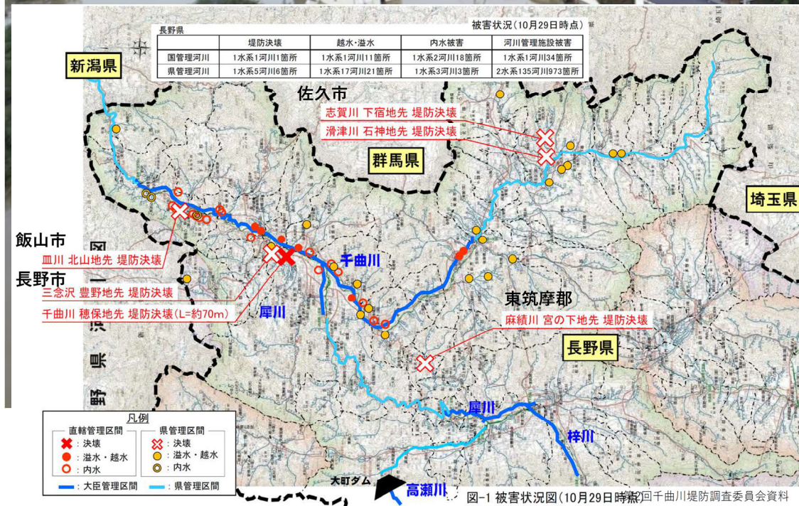
図-1 被害状況図(10月29日時点) 千曲川堤防調査委員会資料