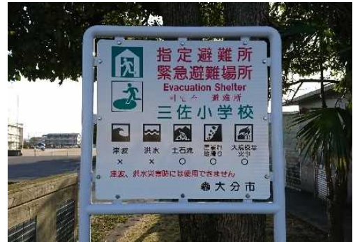
_____の案内板 災害のときにひなんする場所