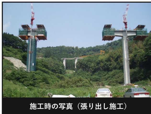
施工時の写真 (張り出し施工)