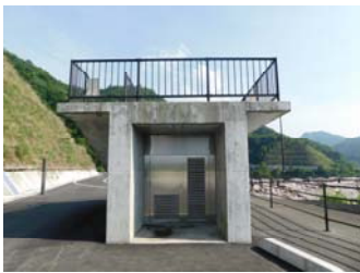
展望台 Observation Platform