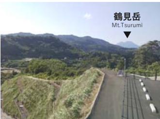
鶴見岳 Mt. Tsurumi