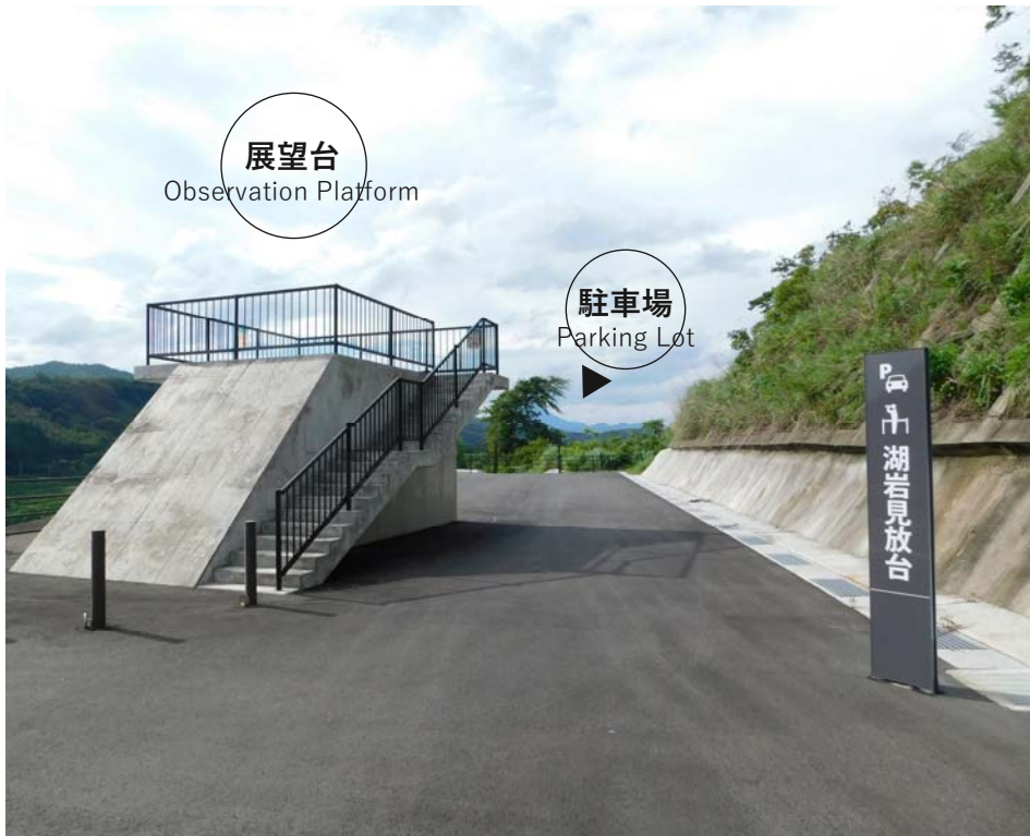
駐車場 Parking Lot