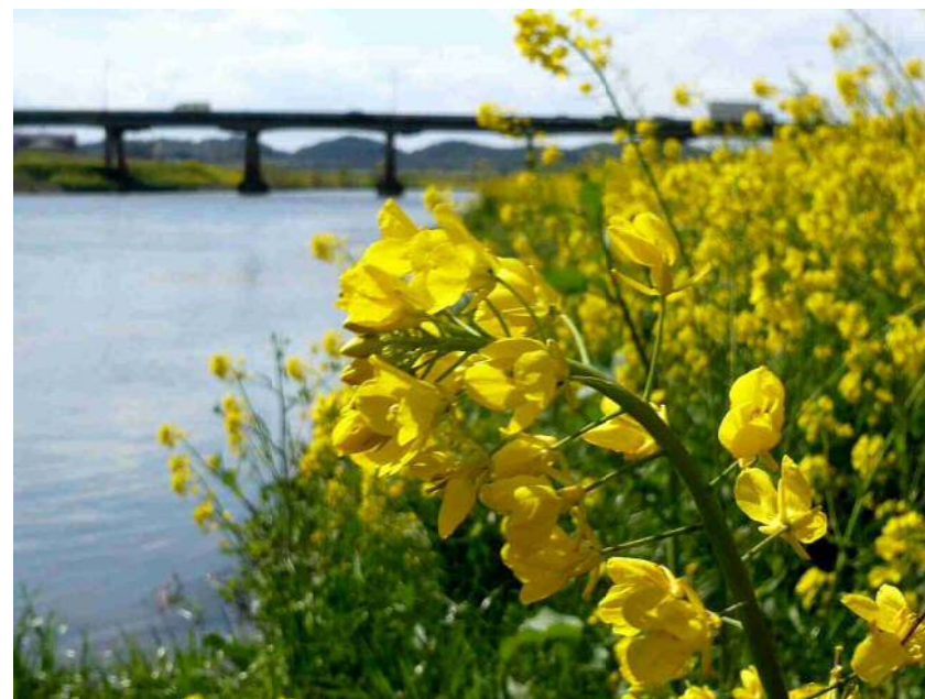
国土交通省 遠賀川河川事務所 遠賀川八景より

国立大学法人 九州工業大学 伊東啓太郎 (Tapio Design Studio) 国土交通省遠賀川河川事務所