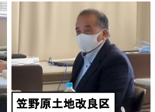
笠野原土地改良区