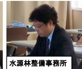
水源林整備事務所