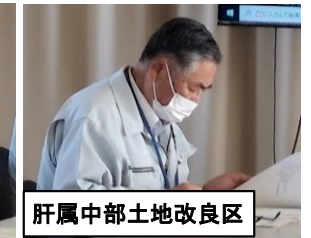
肝属中部土地改良区