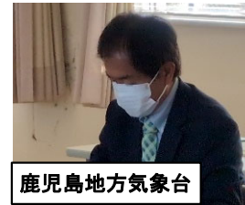
鹿児島地方气象台