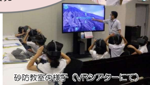
砂防教室の様子（VRシアターにて）