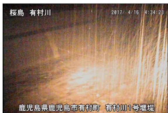
有村川 1 号堰堤