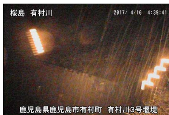
有村川 3 号堰堤