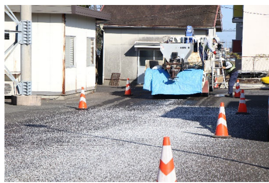
凍結防止剤散布訓練状況