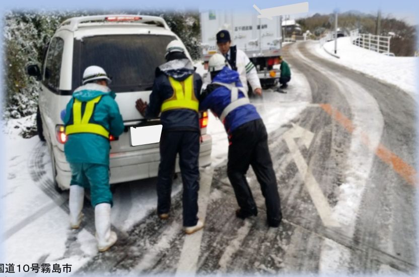
国道10号霧島市 亀割峠での雪対応