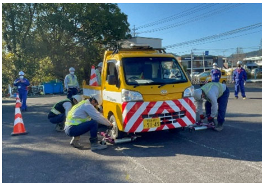
災害対策基本法に基づく車両の移動訓練状況