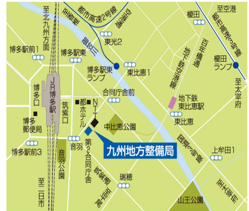
国土交通省九州地方整備局