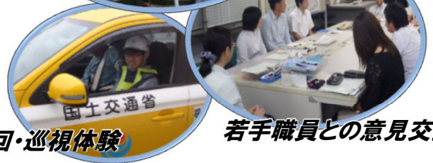
若手職員との意見交換