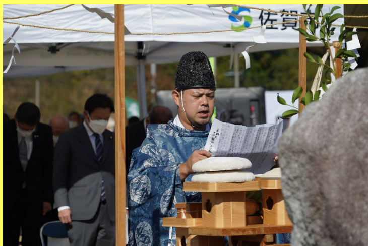
昨年の10周年記念感謝祭の様子