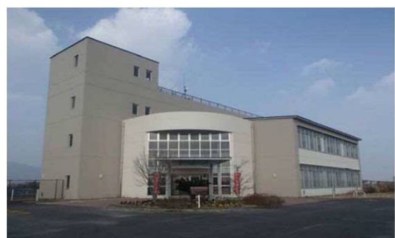
巨勢川調整池管理棟（東名縄文館）