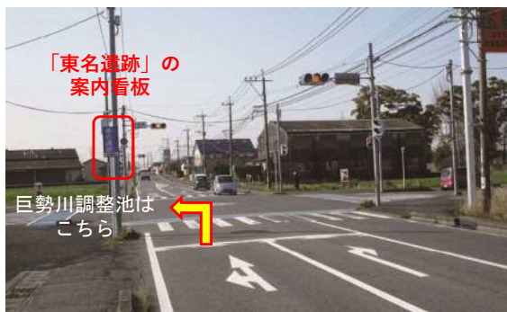
平尾東交差点：北から