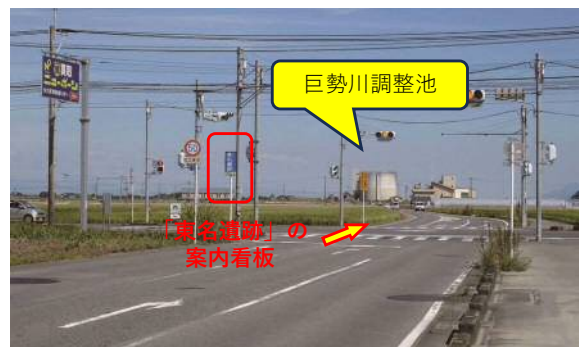
平尾東交差点：西から