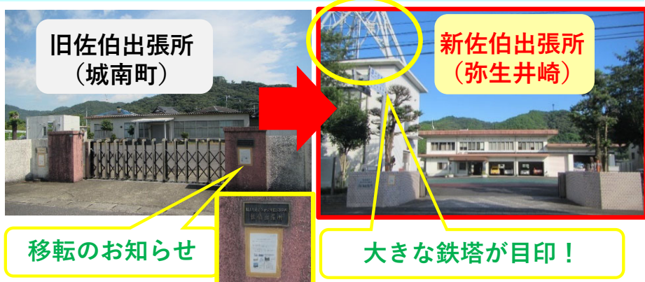
旧佐伯出張所 (城南町)

移転しましても、これまでと変わらずご意見・ご要望等お待ちしておりますので、今後ともよろしくお願いたします。