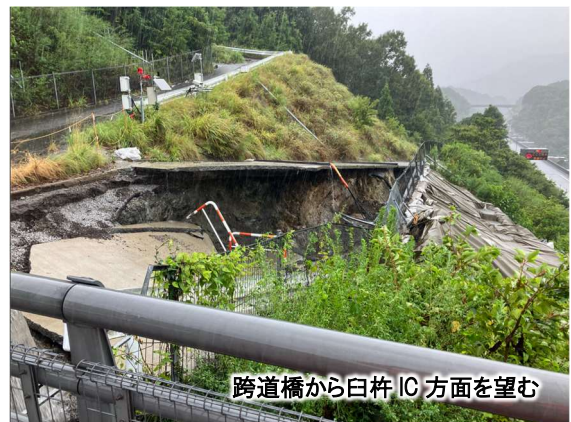
(切土のり面の崩壊)