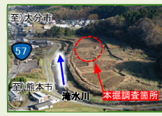
黒い帯状箇所が「溝」

試掘調査で確認される主なもの(遺構・遺物) 遺構・竪穴建物・土坑・溝・ピットなど 遺物・土器・陶磁器・石器・木製品など