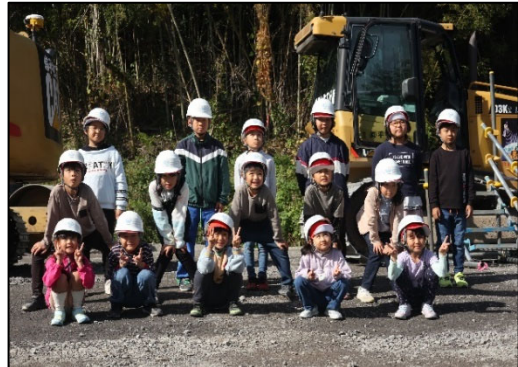
▲ 建設機械の前で集合写真の様子