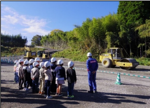
▲ 現場の説明を聞いていただいている様子

竹田市立豊岡小学校の皆さんを招いて、工事の様子を見学していただきました。 日時: 令和5年11月8日(水) 場所: 大分57号上鹿口道路改良(その1)工事(大字会々字上鹿口地先)