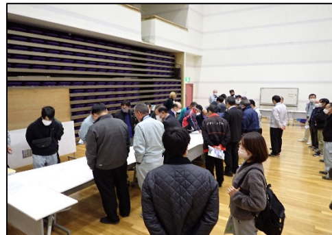
▲ 計画図面の閲覧の様子

是非、佐伯河川国道のホームページをご覧ください！ 進捗状況は、以下のURL又は二次元バーコードで確認できます。 http://www.qsr.mlit.go.jp/saiki/