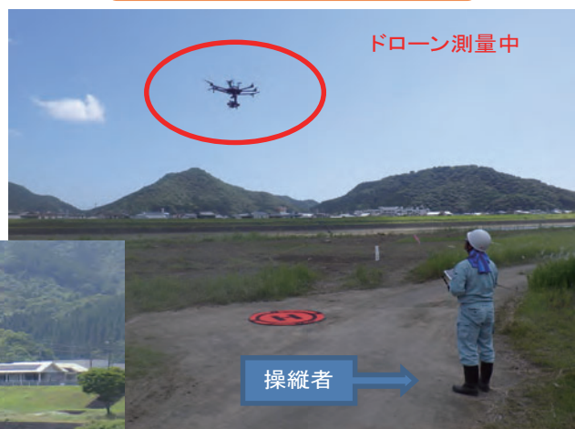
ドローンを使用した3次元測量