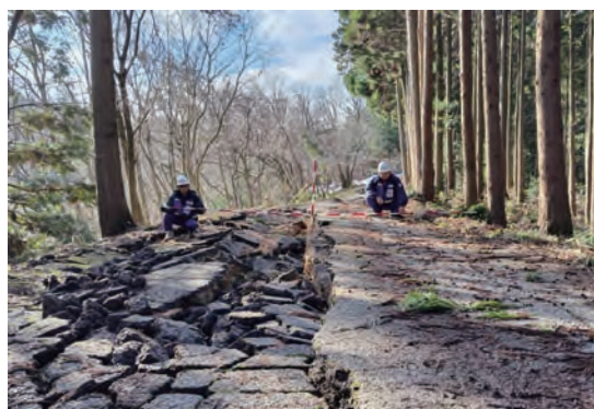
調査状況(石川県輪島市)