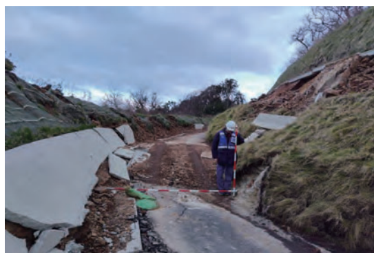
調査状況(石川県輪島市)