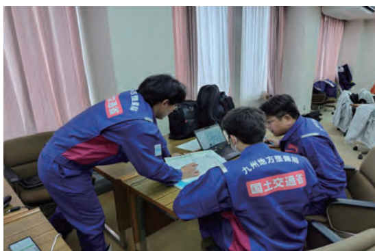
調査とりまとめ状況(石川県輪島市)