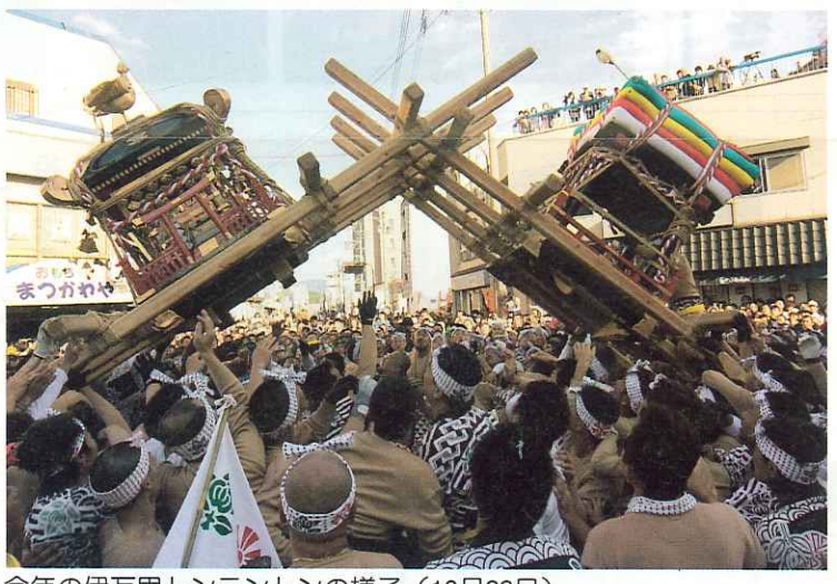
今年の伊万里トントンの様子 (10月23日)

日本三大けんか祭りに数えられる「伊万里トントン」が、今年も10月22日から24日まで勇壮に行われました。秋の豊稔を祝う伊万里神社の御神幸祭で、南北朝時代の故事になぞらえ、荒神輿を楠木方の陸軍、回車を足利方の水軍に見立て、両軍の合戦を模したものだと言われています。「トントン・トン」と打ち鳴らす太鼓を合図に、神輿と回車がガッチリ組み合い、相手方をひっくり返したり、上に乗った方が勝ち。威勢のいい掛け声のなかで繰り広げられた攻防戦は、見ているだけでも熱くなりました。祭りのクライマックスは、24日の夕刻を期して繰り広げられる最後の決戦「川落とし」。組合った神輿と回車が、そのまま伊万里川になだれ落ち、早く陸に引き上げられた方が勝利となり、荒神輿であれば豊作、回車であれば大漁と言われています。ちなみに今年も、回車が勝利しました。