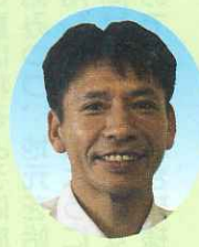
唐津市久里 折尾 命