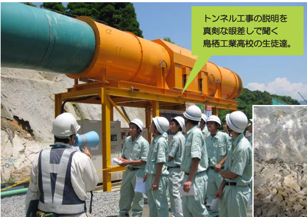
トンネル工事の説明を 真剣な眼差しで聞く 鳥栖工業高校の生徒達。

平成20年7月8日に、佐賀県立鳥栖工業高校の生徒さんが浜玉トンネル(仮称)の施行現場を訪れ、トンネル坑内の掘削現場などを見学しました。浜玉トンネルは、平成21年度に供用予定の唐津道路(二丈鹿家IC〜浜玉IC)の一部であり、鋭意促進中です。 現地を見学した生徒さんからは、「トンネルは1日どれくらい掘れるのか」などの質問や、「見たことのない色々な建設機械が見学できて、よい経験ができました」などの感想があり、興味を持って見学を行っていただきました。また、「西九州自動車道が出来る」と『時間短縮』や『広域的な物流の支援』『救急医療や防災機能が上がり、日常生活の利便性が向上する』という説明にも熱心に聞き入り、西九州自動車道の役割や地域にもたらす効果などを理解していただいたと思います。 今後も、事業を促進していきますので、皆様のご理解、ご協力を宜しく願います。