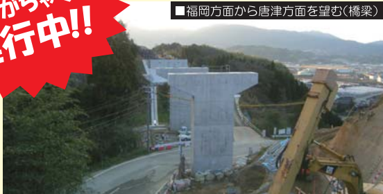
福岡方面から唐津方面を望む(橋梁)