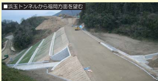
浜玉トンネルから福岡方面を望む

福岡県と佐賀県を結ぶ唐津道路(二丈鹿家IC～浜玉IC)の建設がちやくちやくと進んでいきます。どんどん出来る橋梁などの構造物を見ると、唐津道路の開通が待ち遠しくなります。唐津道路の平成21年内全線開通を目指し、これからも益々頑張つてまいります。