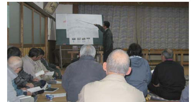
▲工事説明会の様子(浦ノ崎公民館にて)

平成年1月7日に伊万里市浦ノ崎公民館にて伊万里松浦道路において初めて工事説明会を開催しました。 この説明会では、工事の概要として、「何時まで工事を行うのか?」「工事用車両がどこを通るのか?」「交通安全確保のためにこの場所に交通誘導員を配置するか?」等を工事着手に向け地域の方々に詳しく説明を行いました。工事に伴う迷惑をおかけしないように留意しながら工事を進めてまいります。