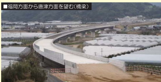
福岡方面から唐津方面を望む(橋梁)