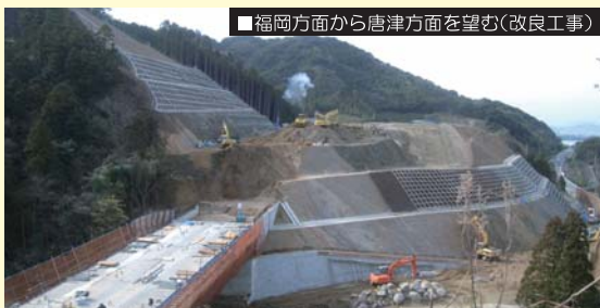
福岡方面から唐津方面を望む(改良工事)