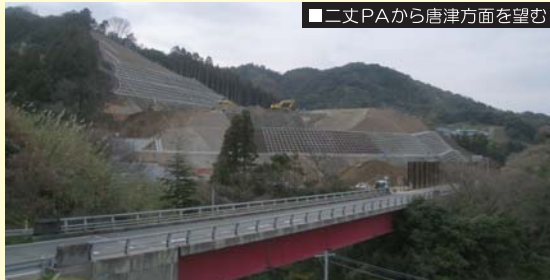
二丈PAから唐津方面を望む