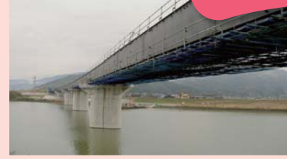
▲唐津方面から福岡方面を望む