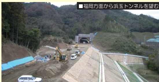
福岡方面から浜玉トンネルを望む