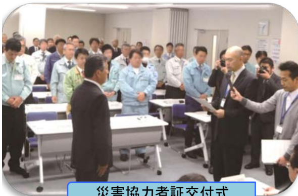
災害協力者証交付式

◆異常時こそ、より正確に情報を把握して関係者間で共有することの重要性を確認しました。