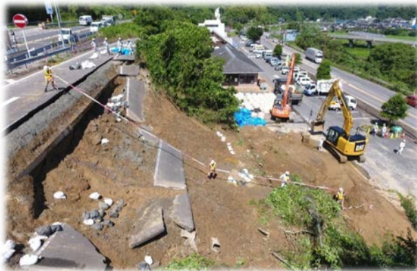
平成30年7月 豪雨災害