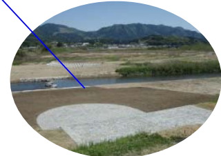
かいたん 階 段・ステージ（既設）