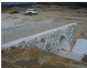
たいこ橋（せせらぎ水路）