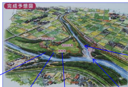
と いし 飛び石（既設）