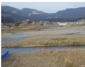
ぜんけい たもくてきひろば 全 景・多目的広場