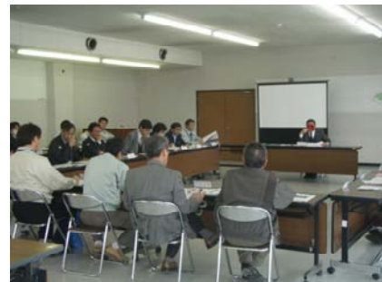
えびの水辺の楽校推進協議会（会議風景）

維持管理はえびの市が主体となり管理されますが、今後、地域の皆さんをいれた維持管理を協議していく場を設置することが確認されました。