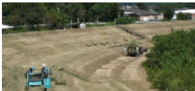
梱包と 受渡し状況

H15年度から環境・コト・再利用面より刈草梱包無料配布が始まり、延べ約660名の畜産農家等に利用（敷きわら・飼料等）されています。1回目の堤防除草が6月中旬から実施しています。