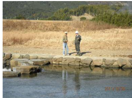
池島の水辺の楽校