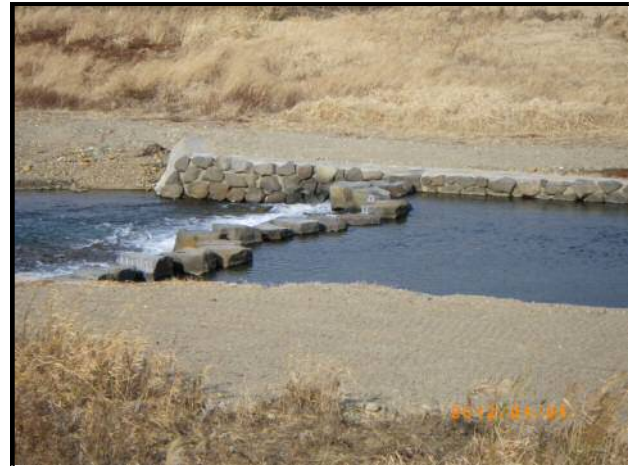
池島川を横断して対岸の公園へ

川内川と池島川の合流点にある公園！ご存じですか？国土交通省により基盤を整備し、えびの市役所で公園利用として整備しています。一度散策してみても如何でしょう！！今年雨が多かった影響で池島川から公園に行くために整備された「飛び石」が山から流れてきた土砂で渡れなくなりましたが、この度、土砂を取り除いて渡れるようになりました。