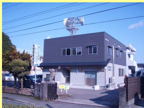
宮之城出張所 庁舎