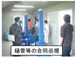
樋管等の合同巡視