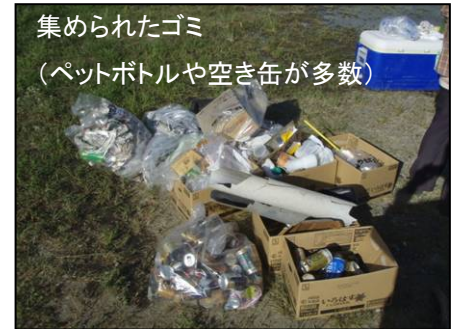
集められたゴミ (ペットボトルや空き缶が多数)

また、清掃と併せて一部除草も行い川辺には広い河原が広がっていますので、ぜひ一度足を運んでみてはいかがでしょうか。