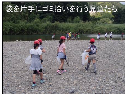
袋を片手にゴミ拾いを行う児童たち