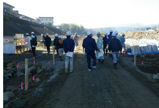
現場に危険がないかパトロールを実施

しっかりとした安全対策により事故なく工事完了を目指すことによって、よりよい河川整備を地域の皆さんに提供できるよう努めていきたいと思っております。