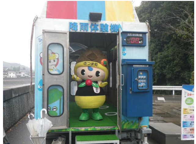
さつまちゃんも防災体験に参加しました