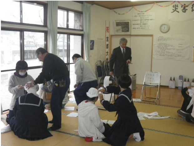
災害時に備えて止血法や包帯法を体験