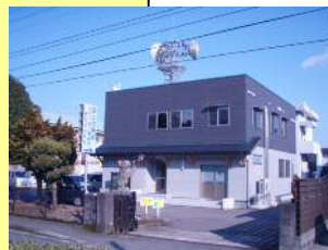
宮之城出張所 庁舎