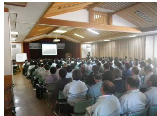
事故傾向・対策等について講習(ひまわり館)