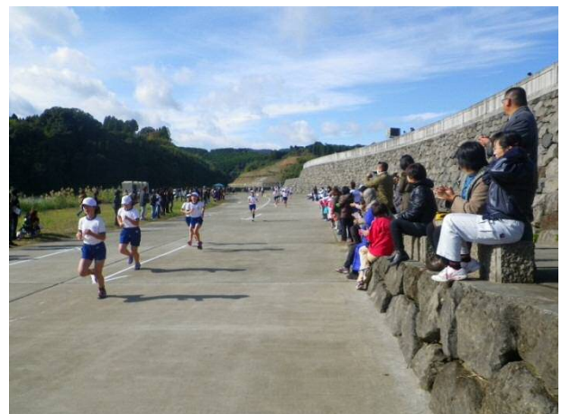
声援を受けながら走る児童たち

児童達は保護者や散歩者等の声援を受けながら最後まで走りきり、走り終えた児童達からは、「川内川の心地よい風を受けながら走れてとても気持ちよかった」などといった声が聞かれました。