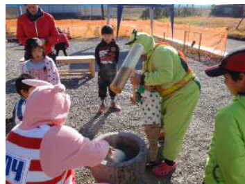
きねを持ちきれない子供はカップと一緒に