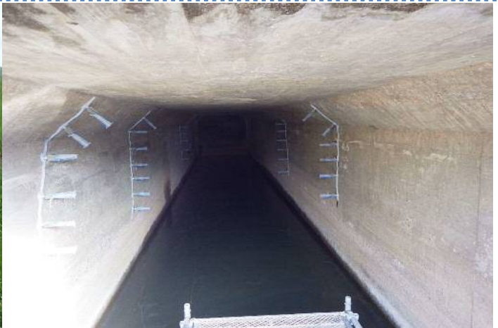
クラック補修工_ひび割れ注入状況(函渠内部)