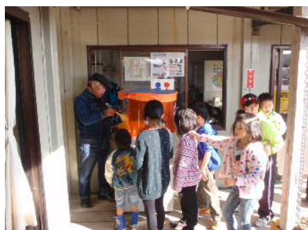
綿菓子製造機前で順番待ちの子供達