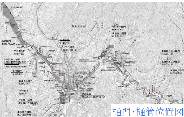
樋門・樋管位置図