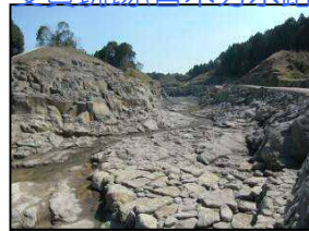
向田地区水制工事 (局長表彰 安全施工)