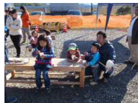
「ぜんざい、おいしいなあ」