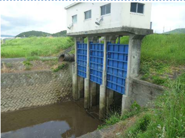
八間川水門全景(薩摩川内市高江町地内)

無事故、無災害で工事完了を目指してまいりますので、ご理解とご協力の程よろしくお願いいたします。