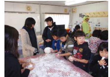
思わずほおぼる子供も