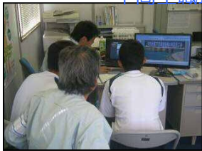
中高生職場体験受入