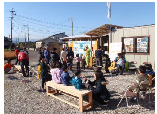
天気も良く、外でくつろぐ親子連れ