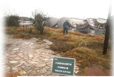
川内港緑地公園ボランティア活動