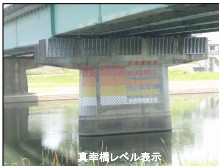
真幸橋レベル表示

今年も梅雨の時期がやってきました。川内川では右図のように水位に応じた危険度レベルを設定しており、インターネット等で水位情報を確認することもでき、現地においても真幸橋の橋脚に着色を行い目安の水位表示をしています。裏面に水位情報の入手方法を記載していますので、参考にしてください。