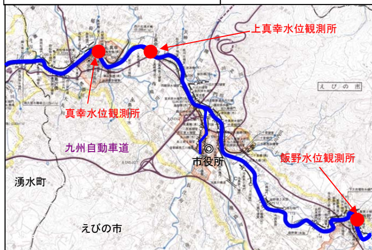
えびの市内水観測所位置図