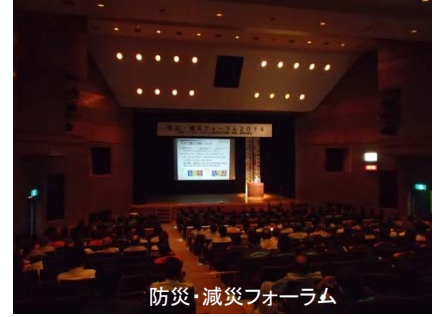
防災・減災フォーラム