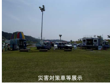
災害対策車等展示