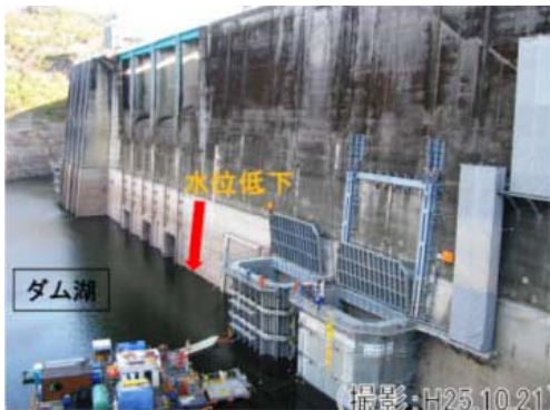
<昨年度の水位低下時の状況>