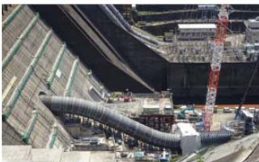
放流管の設置作業状況