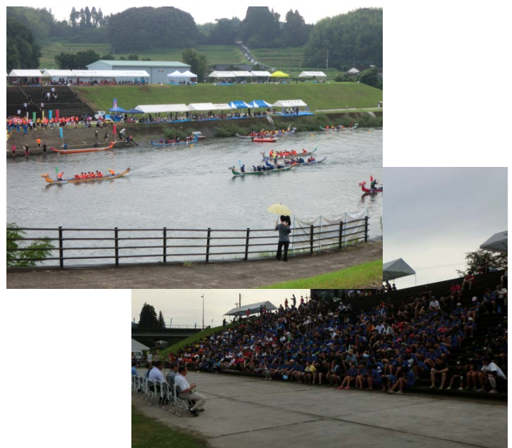
<龍舟祭(ドラゴンボートレース大会)の様子>

平成10年度に河川改修や水辺の楽校の整備などをきっかけに開催されているドラゴンボートレース大会は、川内川を下流から上流へ約170メートルの距離を1チーム10名で漕ぎ競うもので、県外も含め69チームの参加があり、競技も盛り上がりを見せ、多くの方が川内川とのふれあいを楽しむ声が聞かれました。