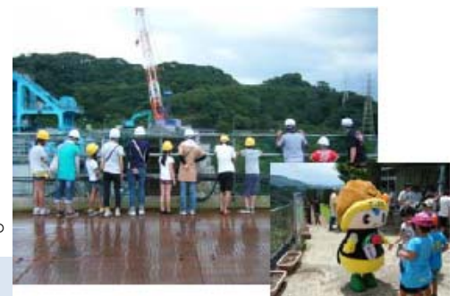
<現場見学会の状況>

夏休み期間中7/19~8/31の期間)約1,200名の方の見学がありました。(さつまるちゃんも現場を見学しました!) 今後も鶴田ダム・再開発事業の見学が出来ます。下記のお問い合わせ先へご連絡下さい。