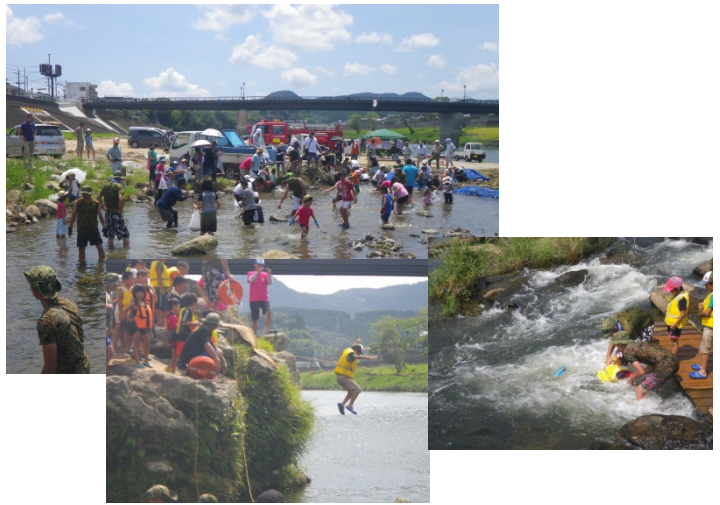
<第10回川原さかなつかみ取り大会の様子>

鮎やウナギのさかなつかみ取りでは、多くの家族の参加もあり、格闘しながらも、たくさんのさかなを捕まえられていました。また、川ながれやとびこみでは、元気な子供たちの楽しむ声が川内川に響き渡りました。