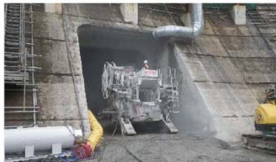
堤体削孔(穴あけ)作業状況