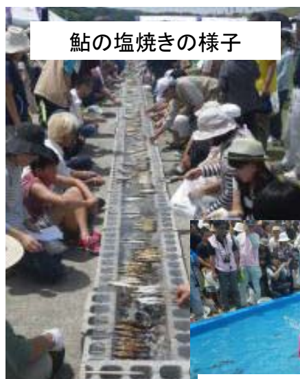
鮎の塩焼きの様子

晴天に恵まれた会場では、鮎の塩焼きや山太郎ガニ（モクズガニ）の放流体験、ニジマスのつかみどりが行われ、多くの家族連れでにぎわい、川内川に楽しむ声が響き渡りました。