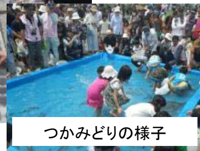
つかみどりの様子