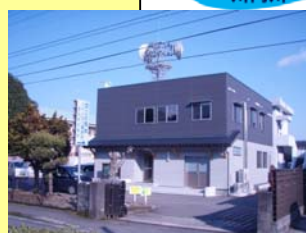
←宮之城出張所 庁舎