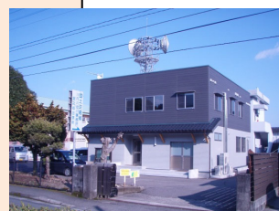
←宮之城出張所 庁舎