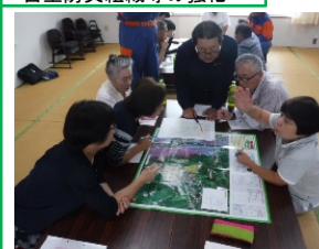
地域住民における 自主防災組織等の強化