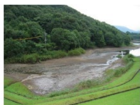
ため池の治水利用