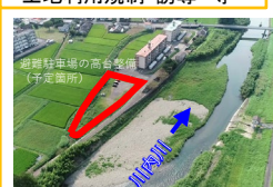
土地利用規制・誘導 等