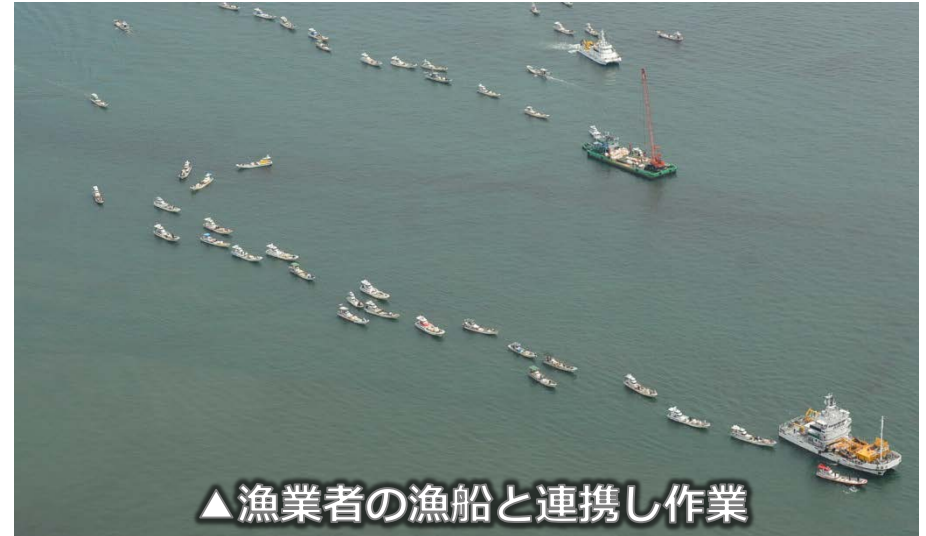
▲ 漁業者の漁船と連携し作業