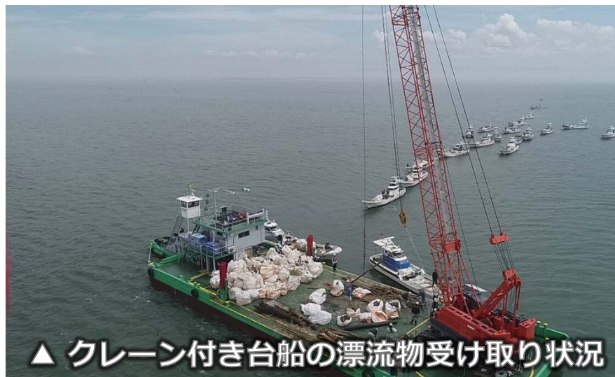
▲ クレーン付き台船の漂流物受け取り状況