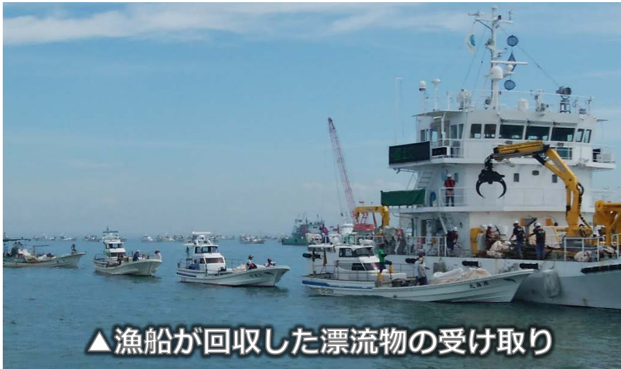
▲ 漁船が回収した漂流物の受け取り