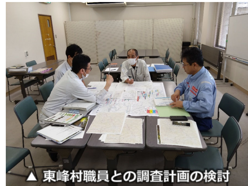
△ 東峰村職員との調査計画の検討