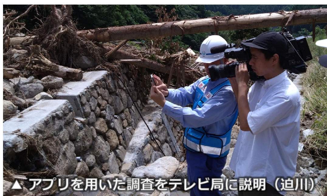
▲ アプリを用いた調査をテレビ局に説明（迫川）