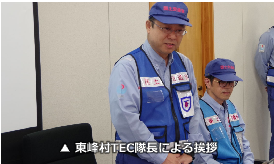
▲ 東峰村TEC隊長による挨拶