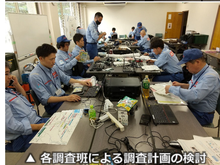
△ 各調査班による調査計画の検討