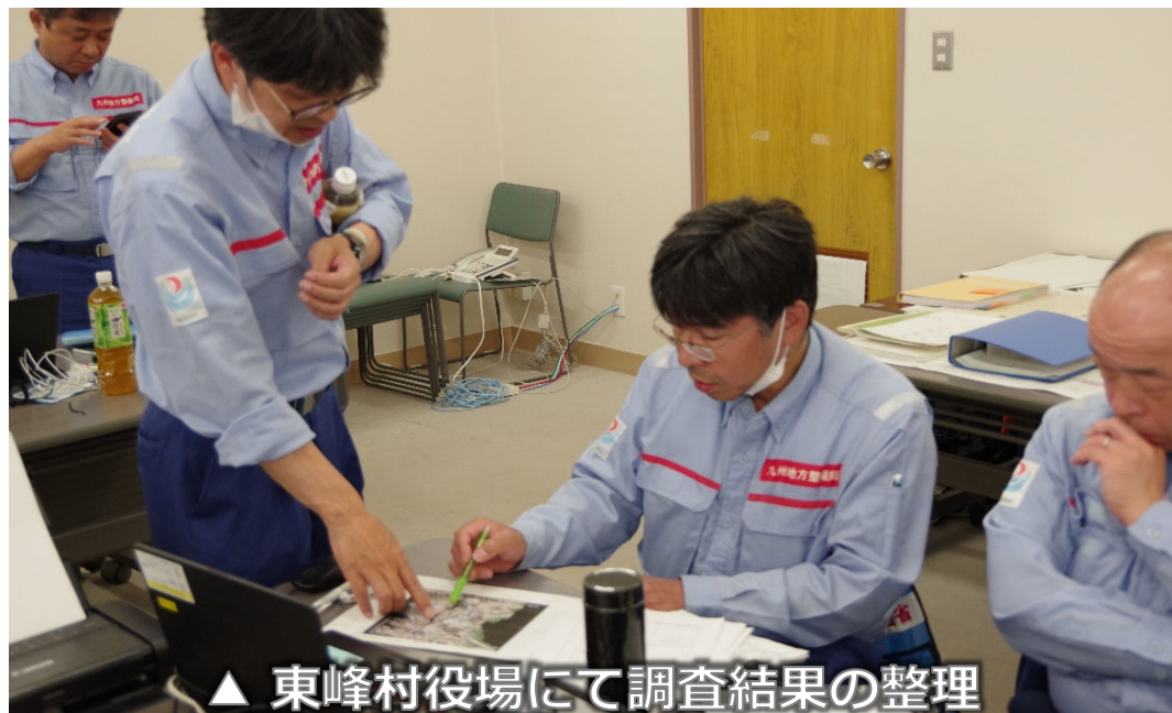
▲ 東峰村役場にて調査結果の整理