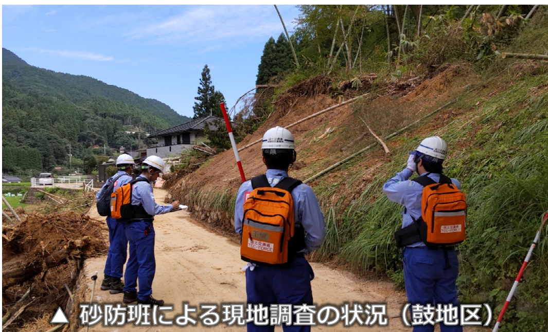
▲ 砂防班による現地調査の状況（鼓地区）