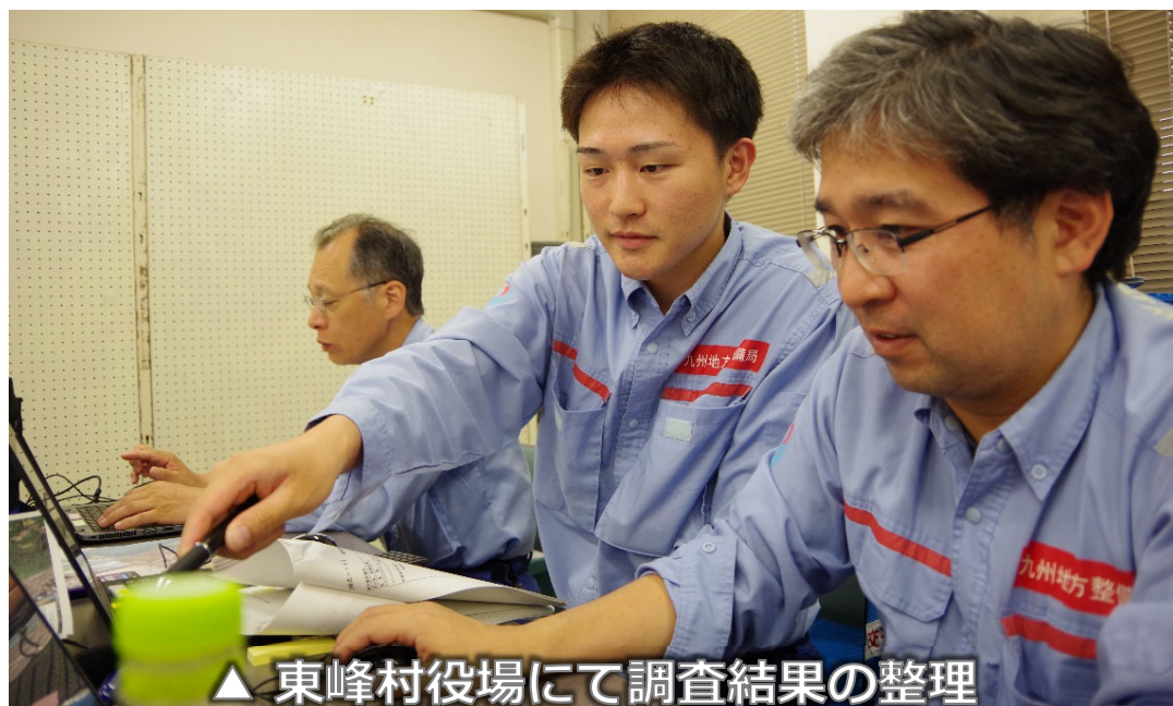
▲ 東峰村役場にて調査結果の整理