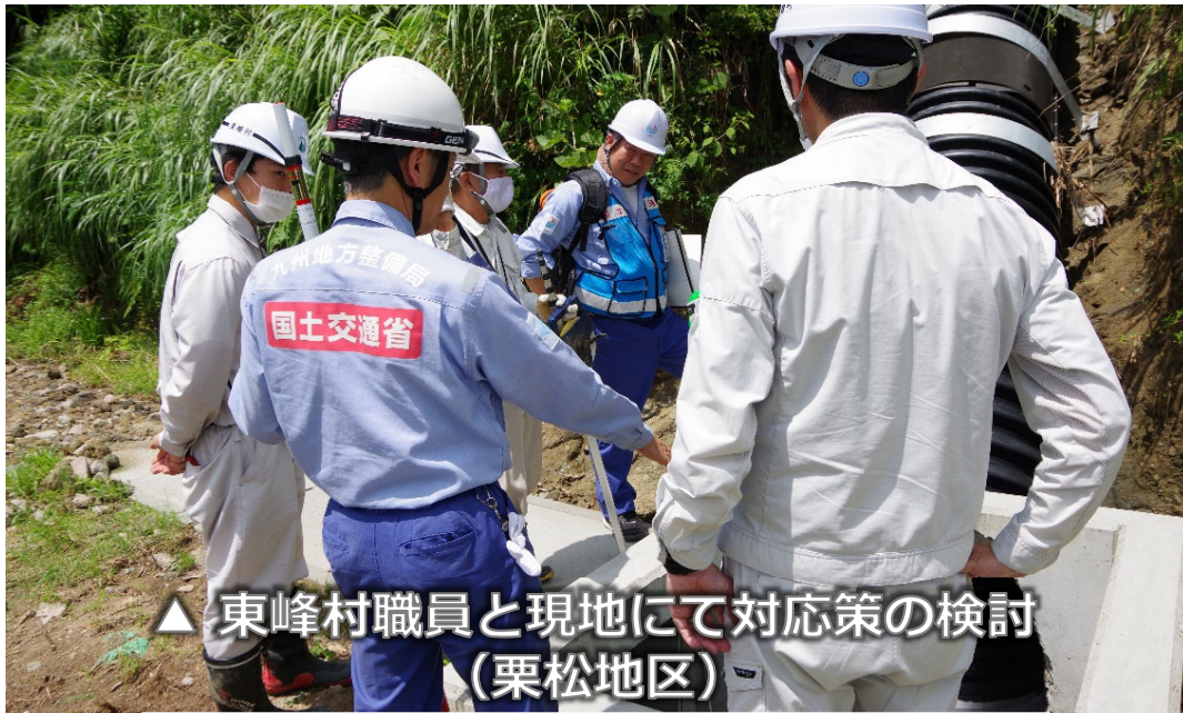
▲ 東峰村職員と現地にて対応策の検討 (栗松地区)

○九州地方整備局TEC-FORCEは、東峰村の村道や河川等の被害状況調査を実施。