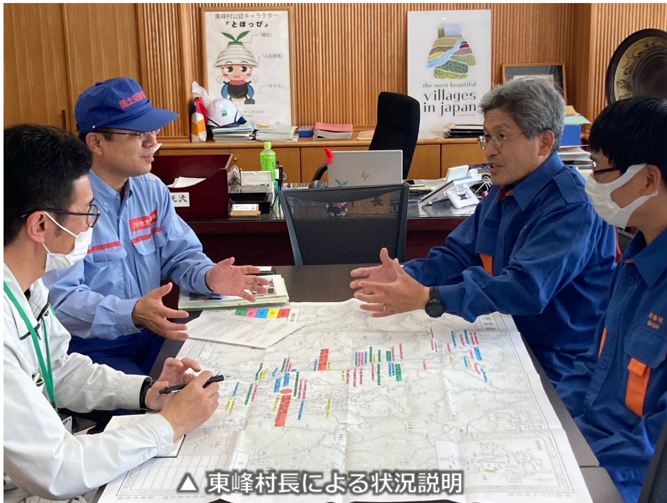
△ 東峰村長による状況説明

○九州地方整備局TEC-FORCEは、東峰村に活動計画を説明し、翌日からの調査計画の検討を実施。