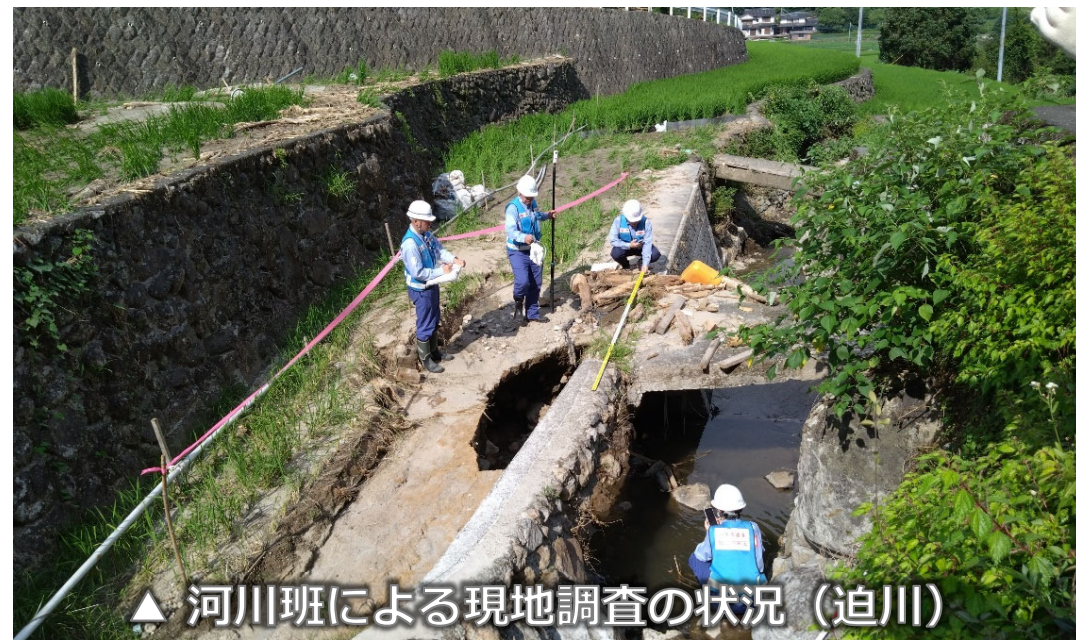
▲ 河川班による現地調査の状況（迫川）