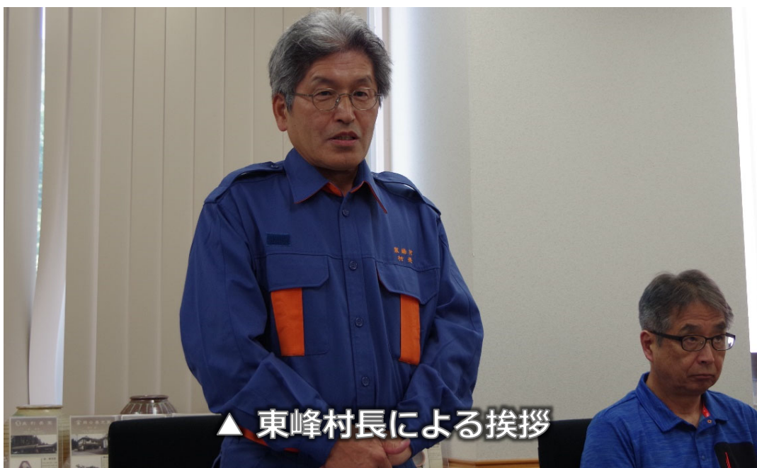
▲ 東峰村長による挨拶