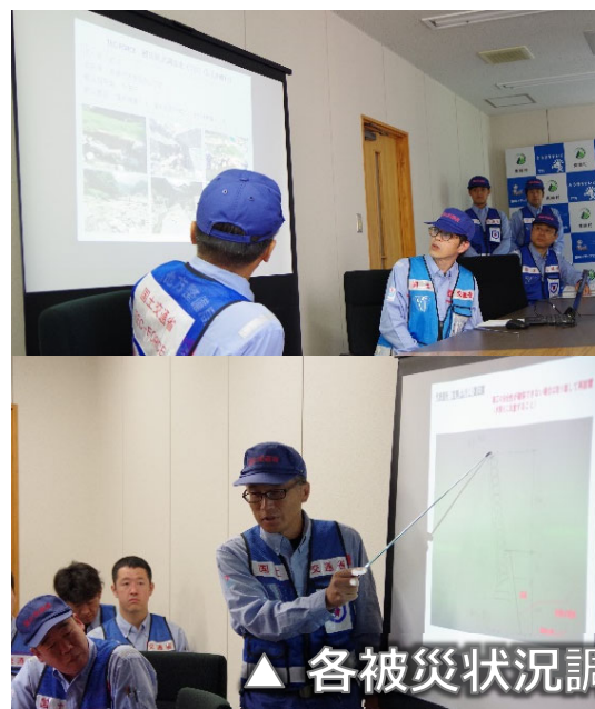
▲ 各被災状況調査班長による説明