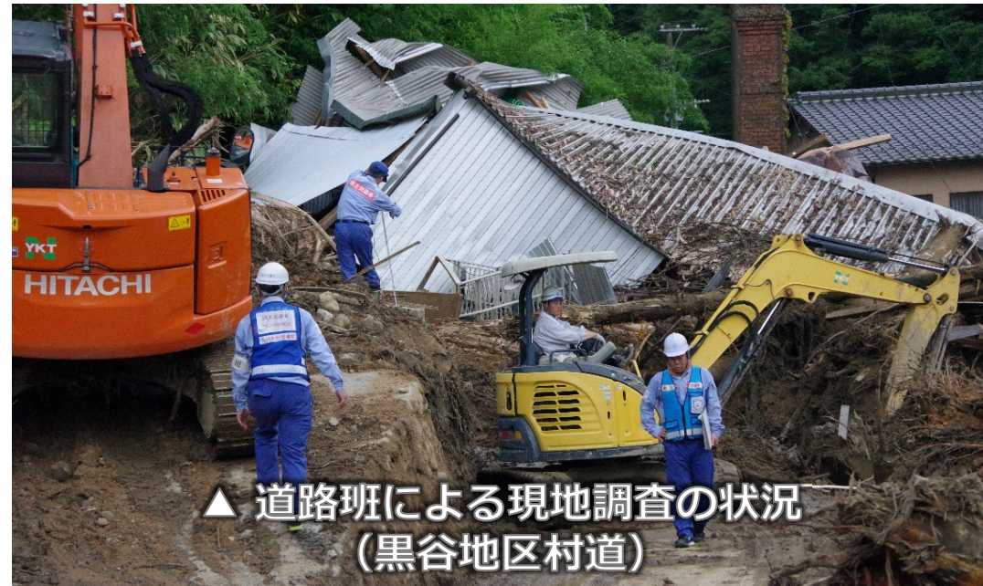
▲ 道路班による現地調査の状況 (黒谷地区村道)