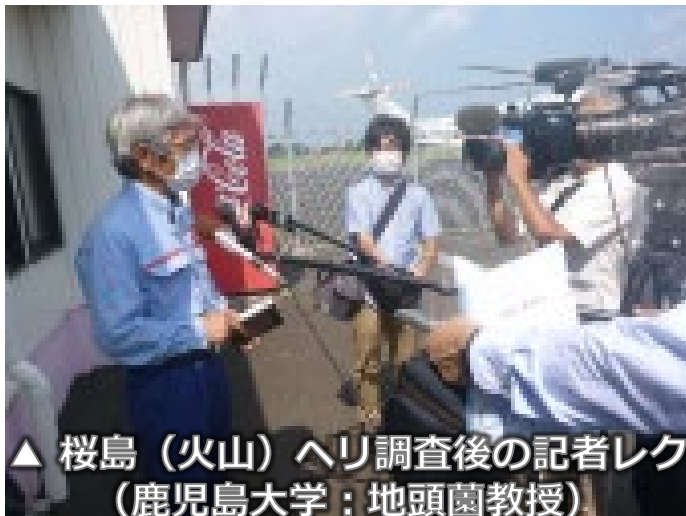
▲ 桜島（火山）へリ調査後の記者レク (鹿児島大学：地頭菌教授)