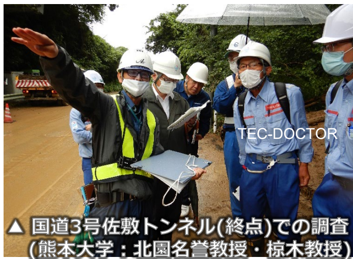
▲ 国道3号佐敷トンネル(終点)での調査 (熊本大学：北園名誉教授・椋木教授)