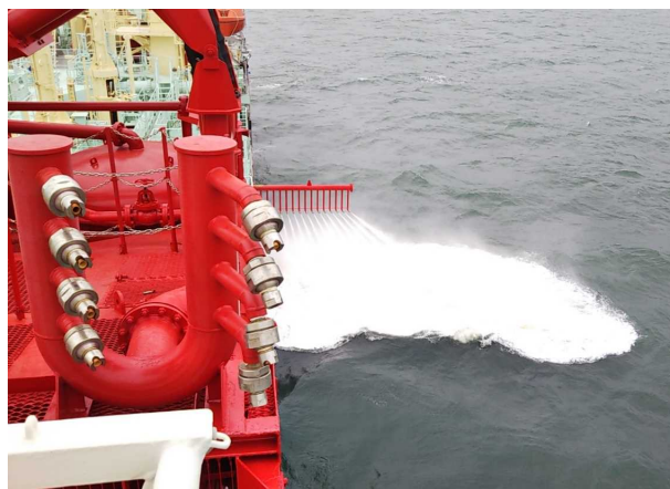
ジェット噴射による流出油の拡散