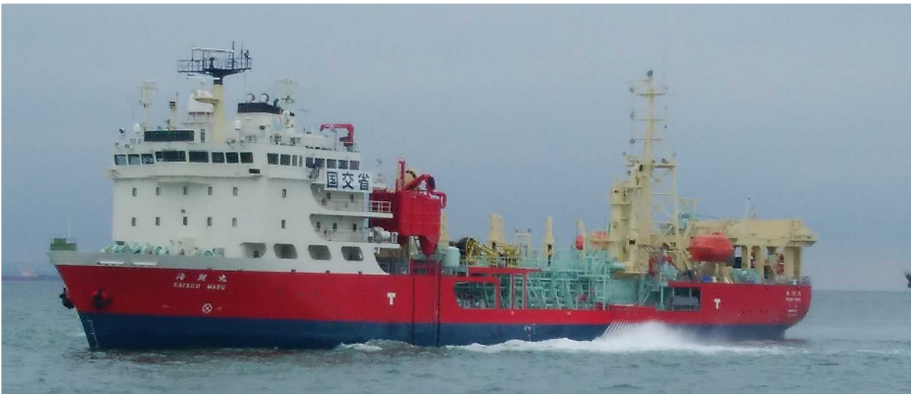
流出油の防除作業を行う浚渫兼油回収船「海翔丸」

台風19号により東京湾の川崎市東扇島沖で発生した、貨物船「JIA DE」沈没による流出油防除のため、九州地方整備局のドラグサクシオン浚渫兼油回収船「海翔丸」が10月14日（月）に北九州港を出港し、本日より現地で流出油防除作業を開始しました。また、関東地方整備局の清掃兼油回収船「べいくりん」は台風通過後の10月13日から作業を開始しており、本日は「海翔丸」と共同で作業を行いました。