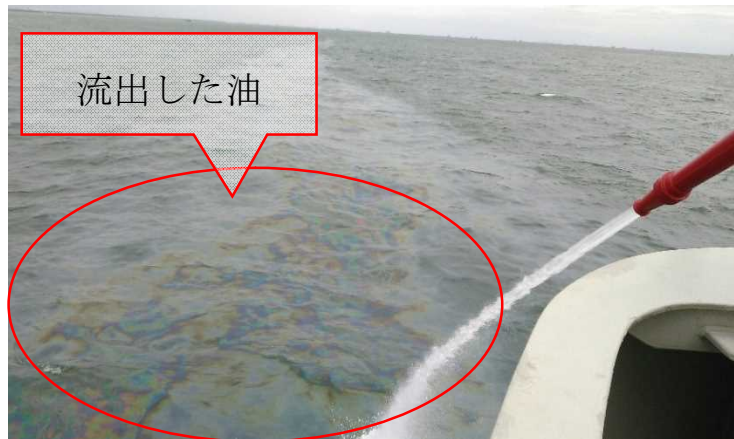
放水銃による流出油の拡散