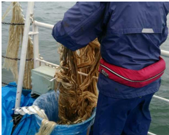
流出油を吸着したマットの回収