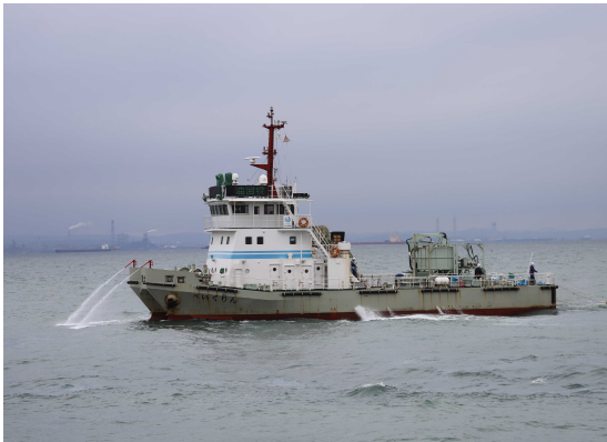
流出油の拡散「べいくりん」