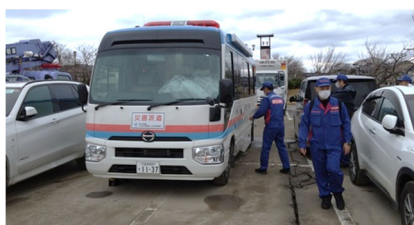
待機支援車(現地TEC支援)