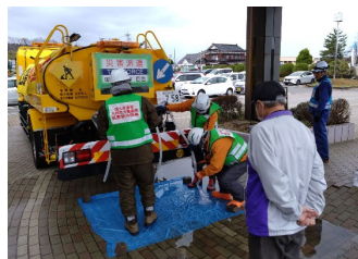
給水支援活動 (志賀町)