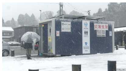
防災用コンテナ型トイレ