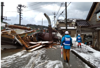
被災状況調査(道路) (輪島市)