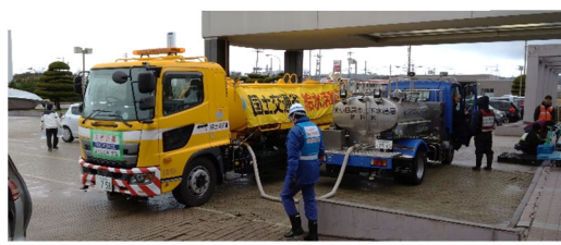
給水機能付散水車(給水支援)