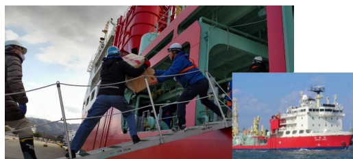
海翔丸(支援物資輸送)